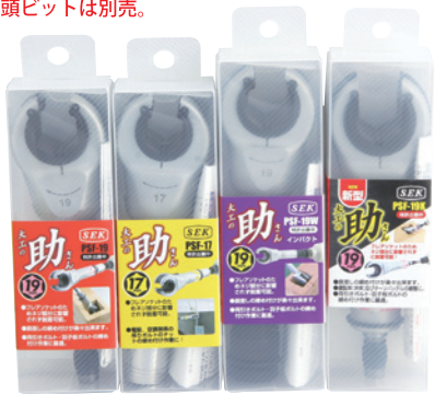
PSF-19 PSF-17 PSF-19W PSF-19K