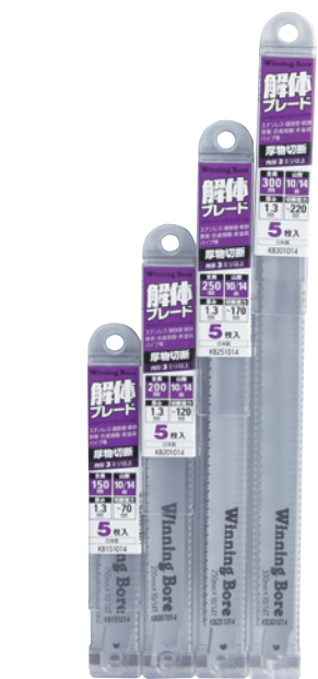
パワータイプ [厚さ1.3mm] (入数5本) 解体現場の必需品 解体ブレード