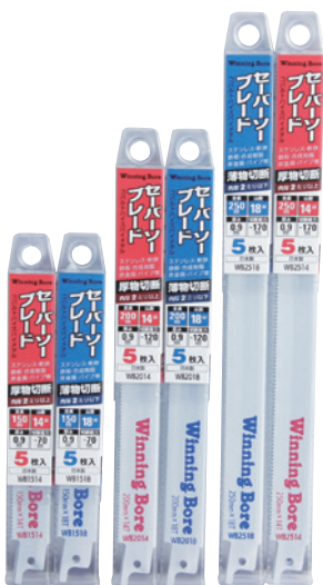
標準タイプ [厚さ0.9mm] (入数5本)