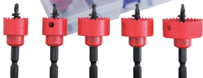
充電バイメタルカッター 薄型ツバ取り仕様価格表